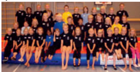
Deltagere i gymnastikskolen august 2009

SG stiller med en række friske instruktører, som vil give børnene en sjov og lærerig oplevelse.